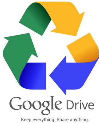
Gambar 2. Logo google drive

Adapun materi yang kami berikan antara lain sebagai berikut: