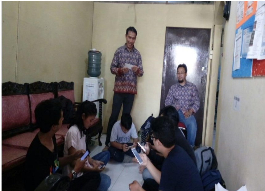
Gambar 1. Suasana peserta pelatihan saat menyimak materi yang diberikan Faktor pendukung kegiatan

maupun untuk penyimpanan informasi. Sesama peserta dapat saling berkomunikasi dan bertukar pikiran baik melalui email, forum diskusi, web blog ataupun melalui media sosial.