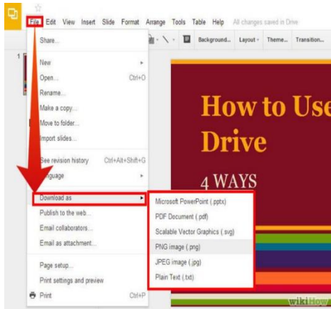
Gambar 3. Cara menggunakan google drive

Lancarnya pelaksanaan kegiatan pengabdian bukan berarti tanpa hambatan. Selama pelaksanaan ada beberapa hal yang diidentifikasi sebagai faktor penghambat kegiatan pengabdian diantaranya ada beberapa peserta yang tidak cukup paket quotanya sehingga akhirnya dipakai jaringan wifi. Sebagian peserta hanya taunya menggunakan smartphone untuk telephone, sms, chat dan bermain game saja, padahal bias digunakan lebih dari itu.