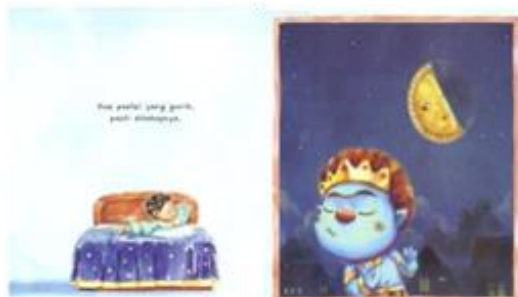
Gambar 3 Buto – Kue Pastel