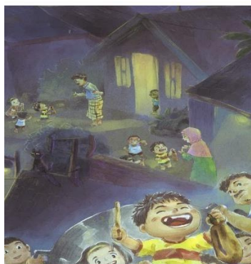
Gambar 1 Buto – Memukul Kentongan

a. “Teman Kecil” Menggunakan Kentongan dan Tradisi Bulan Purnama