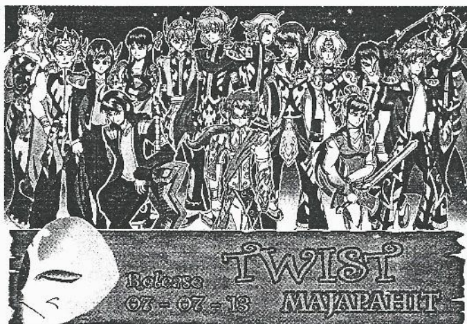
Gambar 1: Visual Novel Twist Majapahit

Produk Visual Novel Indonesia berjudul "Twist Majapahit" menjadi pilihan dalam studi ini, karena masih terbatasnya produksi Visual Novel lokal yang mengangkat tema bernilai sejarah dan budaya Indonesia. "Twist Majapahit" karya pengembang indie, Kawamata Hiruma (menggunakan nama samaran Jepang) diproduksi mulai tahun 2012, dan diluncurkan tahun 2013. Visual Novel ini berkisah tentang perjalanan Kerajaan Majapahit melalui narasi 12 karakter Raja-raja Majapahit dengan gaya visual yang mendapat pengaruh dari gaya anime .