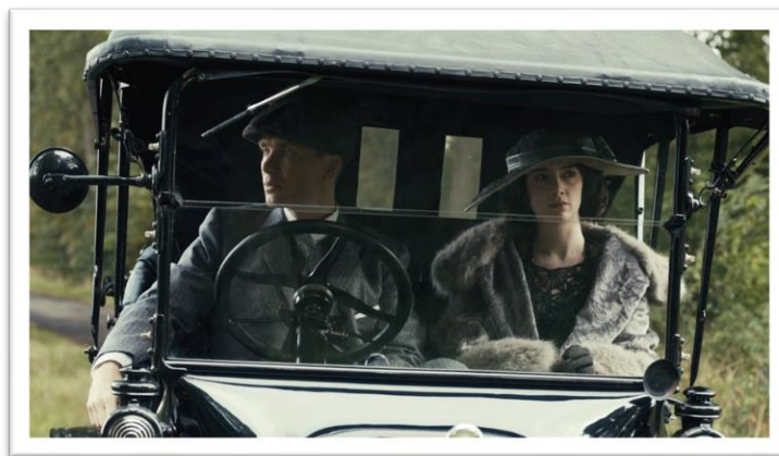
Gambar 3. Scene yang menggambarkan Thomas Shelby sedang berada di dalam mobil mewah dengan seorang wanita.

Namun berdasarkan teori simulakra, dapat dianalisis bahwa tokoh utama Thomas Shelby tidak memiliki catatan sejarah memiliki hubungan romansa dengan seorang gadis bernama Grace. Tokoh Thomas Shelby dan Grace Burgess pun tidak ada pada realita yang sebenarnya.