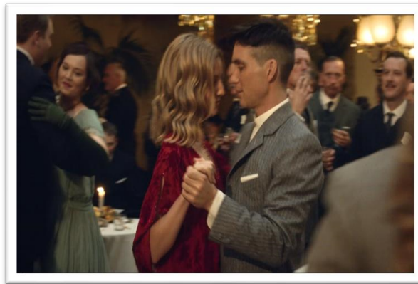
Gambar 1. Scene yang menggambarkan Thomas Shelby sedang berbincang dengan Polly Shelby.

Menurut Haryatmoko (2010: 24), terdapat empat tahap dalam simulasi yaitu representasi ketika citra menjadi cermin. Ideologi dipercaya ketika citra menyembunyikan realitas sehingga terciptanya gambar palsu, Citra kemudian menghilangkan realitas dan menjadi realitas yang baru, dan citra tidak terkait dengan realita apapun.