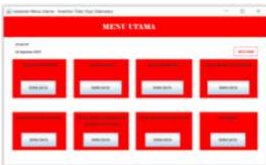
Gambar 6. Tampilan Halaman Menu Utama

Tampilan layar halaman masuk untuk masuk ke menu utama, yang mana pengguna harus mengisi data nama pengguna serta kata sandi sesuai database .