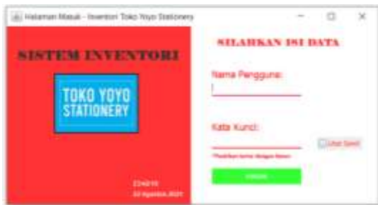
Gambar 5. Tampilan Halaman Masuk

Peneliti merancang tampilan aplikasi ini dengan menggunakan aplikasi netbeans 8.2. Berikut tampilan dari aplikasi inventori Toko Yoyo Stationery: