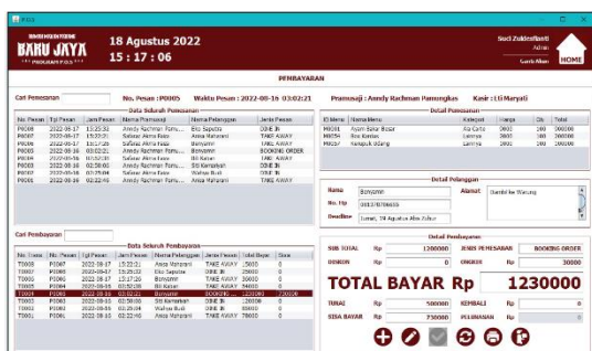
Gambar 10. Tampilan Form Pembayaran

Tampilan form pemesanan digunakan untuk menambah pemesanan pelanggan.