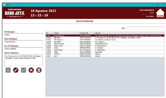
Gambar 8. Tampilan Form Data Pelanggan

Tampilan form data pegawai digunakan untuk menambah data pegawai yang nantinya akan digunakan untuk login pada aplikasi sistem.