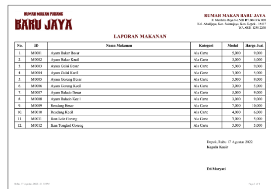
Gambar 12. Tampilan Laporan Makanan

Tampilan form cetak laporan transaksi digunakan untuk untuk mencetak data transaksi.