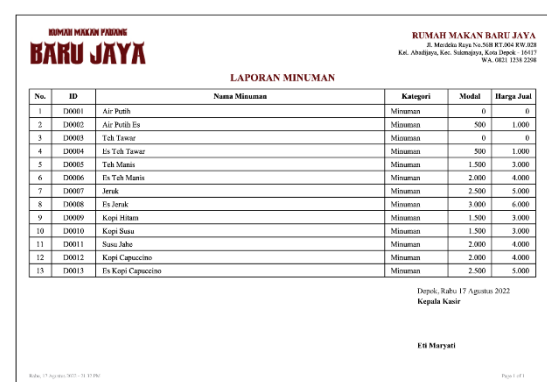
Gambar 13. Tampilan Laporan Minuman

Tampilan ini berisi seluruh data makanan yang tersimpan di database untuk dijadikan laporan makanan.