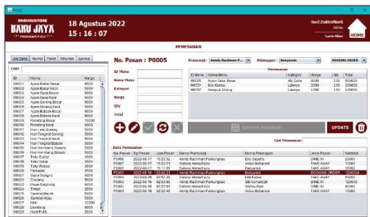
Gambar 9. Tampilan Form Pemesanan

Tampilan form data pelanggan digunakan untuk menambah data pelanggan yang nantinya akan ditampilkan di form pemesanan dan pembayaran.