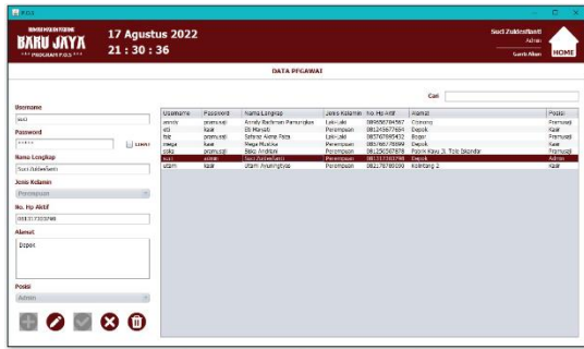
Gambar 7. Tampilan Form Data Pegawai

Tampilan form data pegawai digunakan untuk menambah data pegawai yang nantinya akan digunakan untuk login pada aplikasi sistem.