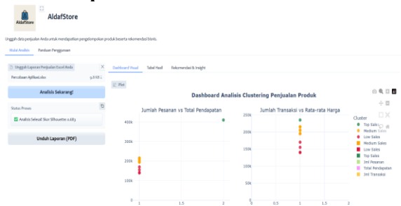
Gambar 4. Tampilan Setelah Analisis Data Uji