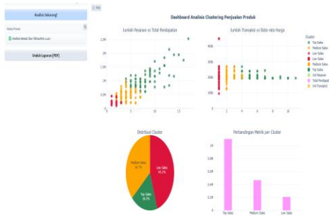
Gambar 6. Tampilan Visual Data Penjualan Aldaf Store dalam 1 Tahun