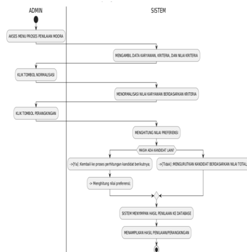
Gambar 2. Activity Diagram Penilaian

Gambar 1 di atas merupakan Use Case Diagram untuk sistem pendukung keputusan pemilihan karyawan terbaik berbasis metode MOORA di PT. Usaha Pribumi. Diagram ini memperlihatkan aktor yang terlibat, yaitu Admin dan Pimpinan Perusahaan, beserta fungsionalitas yang dapat dilakukan masing-masing aktor. Admin memiliki akses untuk mengelola data penilaian, alternatif, kriteria, dan sub kriteria, serta memproses perhitungan MOORA dan mencetak laporan. Sementara itu, Pimpinan Perusahaan dapat melakukan login dan melihat hasil perhitungan yang dihasilkan oleh sistem. Diagram ini juga memetakan relasi antar use case yang saling terhubung untuk memastikan alur proses berjalan terstruktur dan sesuai kebutuhan pengguna.