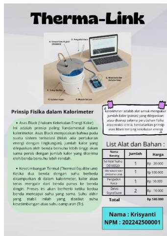
Gambar 2. Desain perancangan alat kalorimeter

Tahapan pertama adalah perencanaan dan perancangan alat, tahapan ini mencakup perencanaan skema desain alat dan komponen komponen yang diperlukan oleh alat kalorimeter. Desain alat ini, di desain pada aplikasi Canva. Desain atau skema rangkaian yang dihasilkan dari alat ini ditunjukkan pada gambar 2.